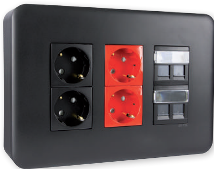
Postos de Trabalho